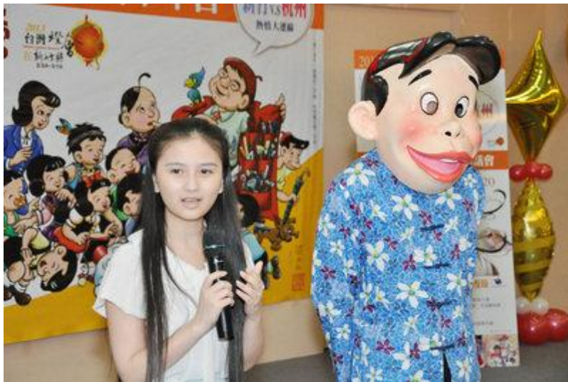
夏達參加漫畫高峰會 (圖)

新竹縣首屆國際漫畫高峰會暨兩岸交流夏令營 11 日在大華科技大學舉行，中國大陸漫畫家夏達（左）參加。右為台灣漫畫人物「阿三哥」。101 年 8 月 11 日