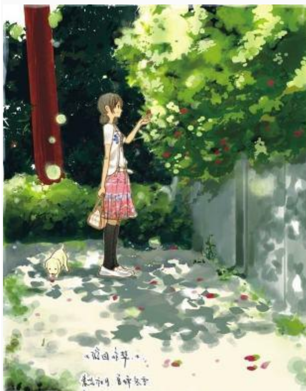
中國當代漫畫家。他的畫風清新，敘事散文化，代表作《夢裡人》，曾創內地漫畫界連載最長紀錄。